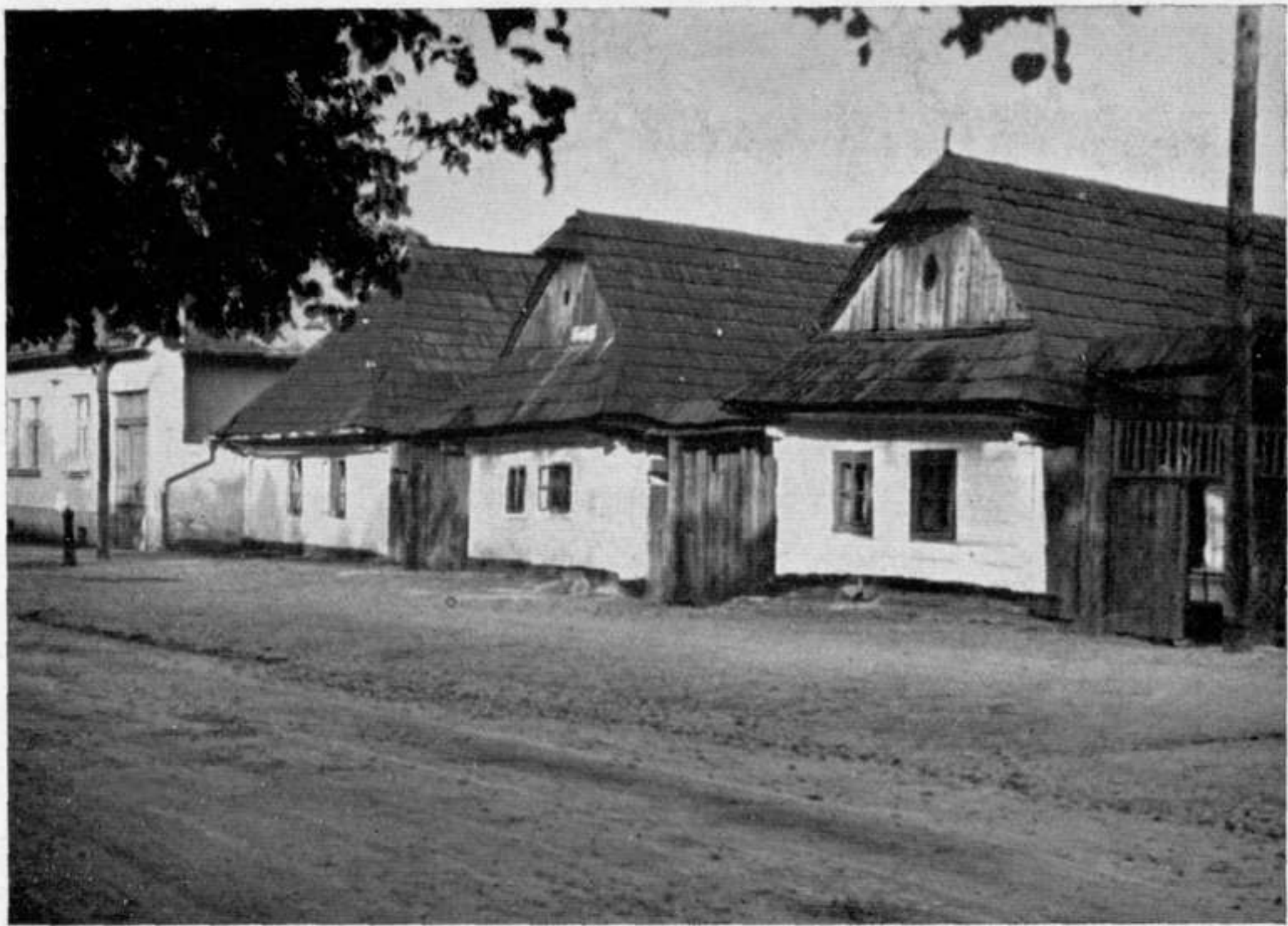
Abb. 1 und 2. Alte Häuser am Stadtplatz in Rosenberg.