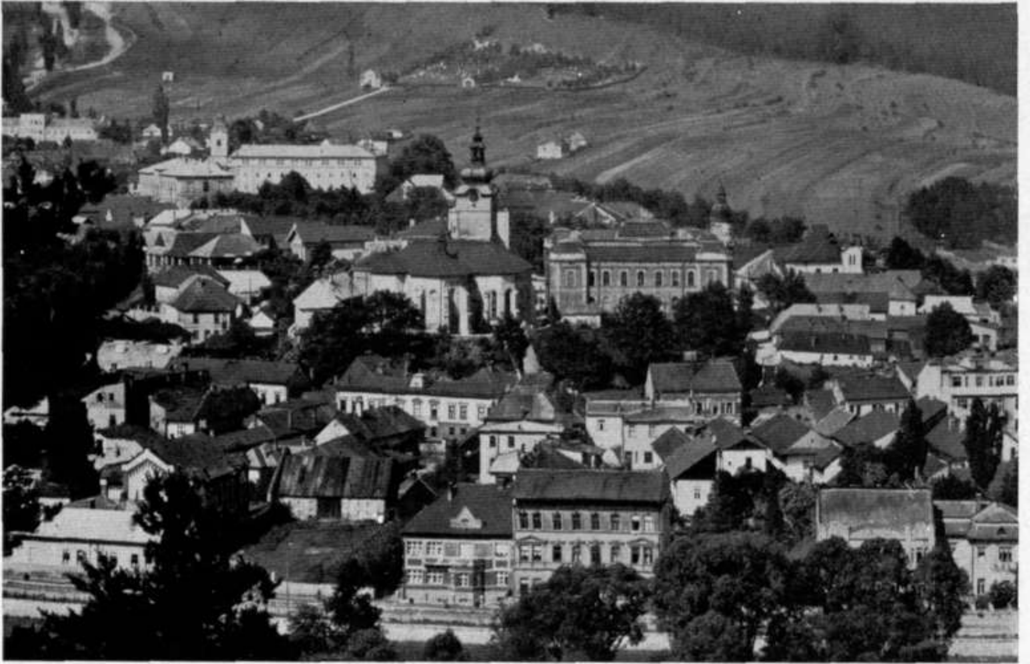
Abb. 3. Rosenberg.